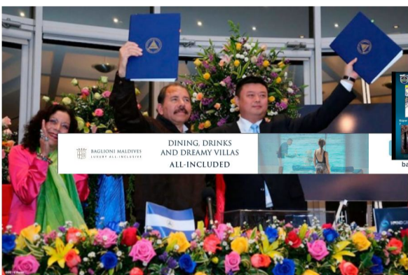
Daniel Ortega junto al empresario chino Wang Jing tras la firma del tratado de construcción del Canal Interoceánico, el cual despojaría de sus tierras a cientos de nicaragüenses.

SUSCRIBITE PARA QUE PODAMOS SEGUIR INFORMANDO.